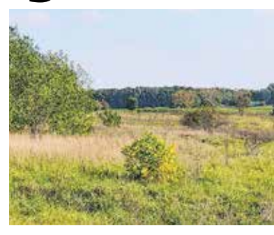
Arról, hogy az emlékhelyen pontosan mi épül majd és milyen feltételekkel, további egyeztetések lesznek.

Bár a domb nyugati oldala lakóházakkal beépült, a keleti rész jelenleg is szabadon megközelíthető terület, így alkalmas a nemzeti emlékhely funkciójának betöltésére. A nemzeti emlékhellyé nyilvánítást a Magyar Patrióták Közössége kezdeményezte, javaslatuk mellett a kőbányai képviselő-testület is egyhangúlag kiállt tavaly ősszel.