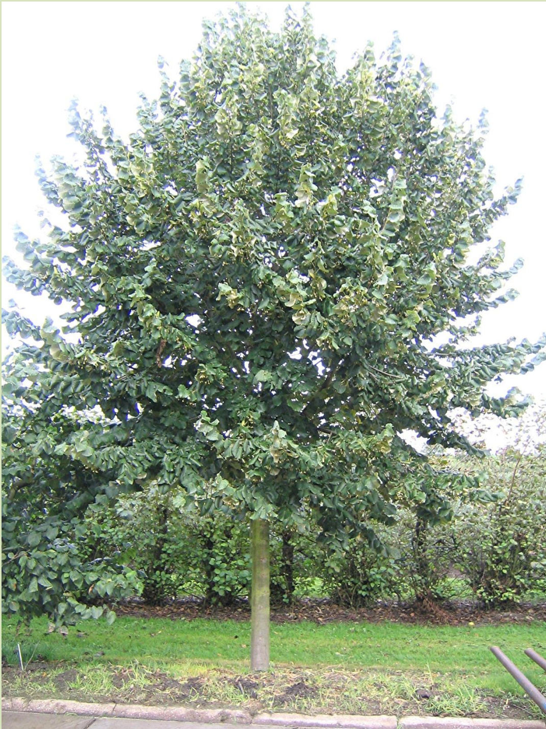
Zeewolde, Vermeerderingstuin; zomer 2010, 8 jaar na het planten.