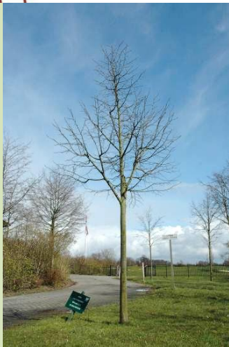
Winterbeeld jonge boom