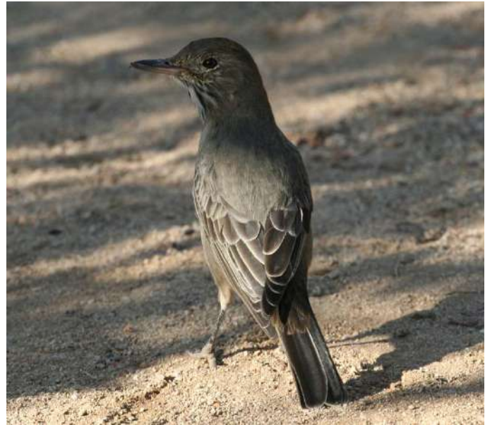
Mero ( Agriornis livida ), Reserva Nacional Las Chinchillas (Reg. IV), foto F. Schmitt.

En nuestro desafío anterior se muestra a un ave de espalda. Echando un primer vistazo a la imagen, determinamos al instante que se trata de un passeriforme. En un segundo análisis, por su forma y color oscuro se nos viene la imagen de un grupo de aves muy conocido en Chile como son los zorzales, pero sus patas negras, alas con finos ribetes claros y cabeza y dorso uniformes nos obliga a abandonar esta idea y buscar la posible respuesta entre los tiránidos. Quizás una extraña dormilona corpulenta de cola larga...? No, definitivamente se trata de un "mero", un grupo de aves muy particulares que las encontramos en